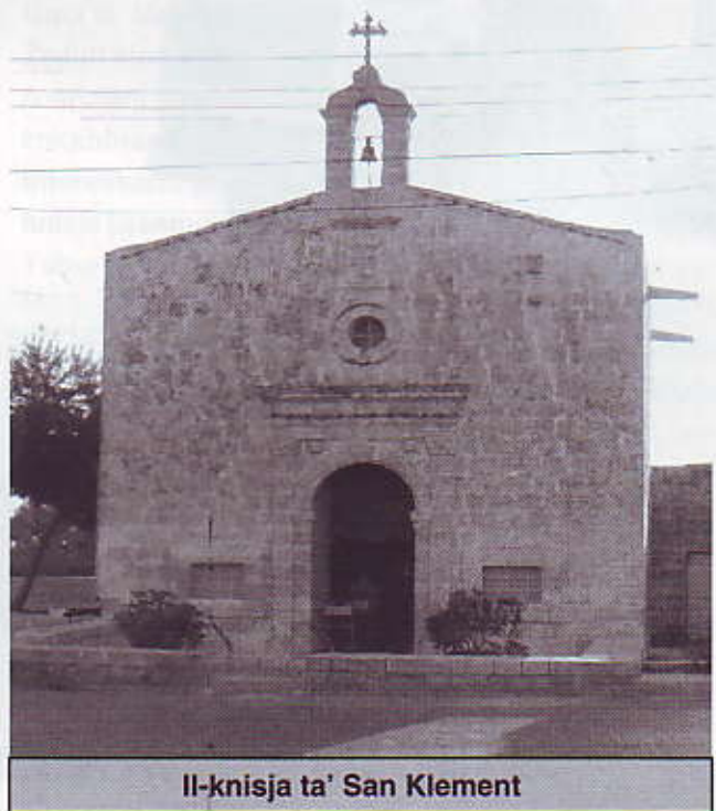
Il-knisja ta' San Klement